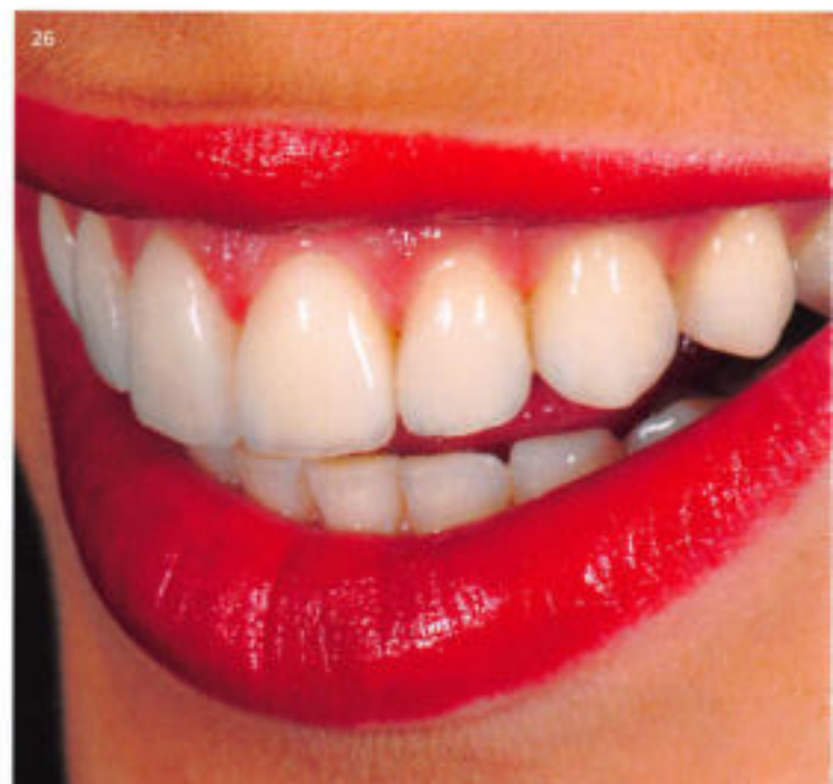
24 – 26 Vorher-Nachher: Der Erfolg der Behandlung beruht unter anderem auf der Wahl des idealen Restaurationsmaterials, einem Konzept, bei dem die Bedürfnisse des Patienten im Vordergrund stehen, und auf einem zielgerichteten Vorgehen. So konnte diese Patientin mit einer wenig invasiven Versorgung mit keramischen Veneers glücklich gemacht werden

auch viele andere Teams sehr erfolgreich nach einem ähnlichen Konzept. Denn unabhängig vom Konzept verfolgen sie alle ein Ziel für ihre Praxis oder ihr Labor. Und auch wenn es nach einem abgenutzten, psychologischen Coaching-Spruch klingt: Für seinen Erfolg ist jeder selbst verantwortlich. Als Zahnmedizinisch/