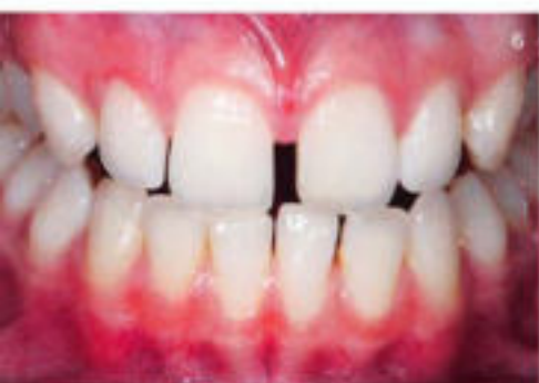
6 Ein anderer Fall: Der Patient wünschte sich das Verschließen des Diastemas