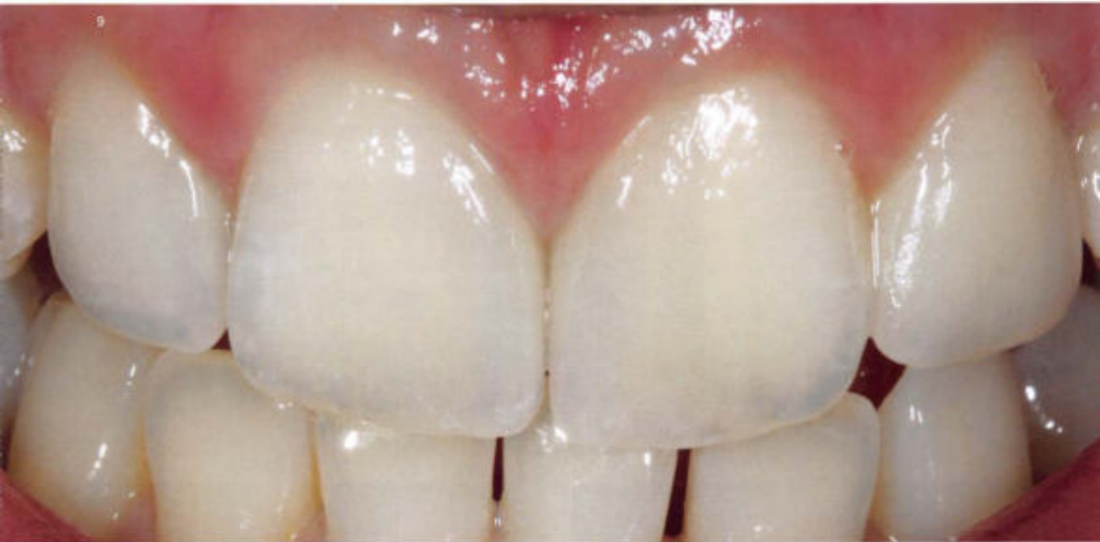
9 Der Patient wünschte den Lückenschluss zwischen seinen beiden oberen Einsern und wurde hierzu noninvasiv mit auf feuerfesten Stümpfen direkt geschichteten Veneers aus Vita VM 13 versorgt (vergleiche Ausgangssituation in Abb. 6)

Unsere Patienten konsultieren uns in den meisten Fällen mit sehr komplexen, ästhetisch-funktionell indizierten Problemen und suchen unsere Hilfe. Bereits beim ersten Termin soll unser Patient von unserem