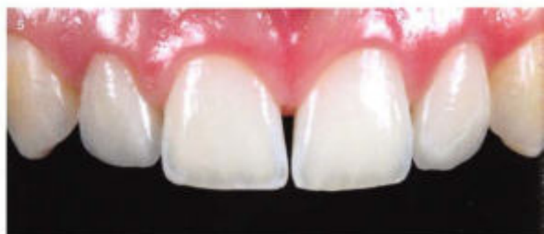
4 & 5 Links die Situation aus Abb. 3 vor und rechts nach der Versorgung mit Keramikveneers aus Vita VM 13 auf den Zähnen 12 und 22