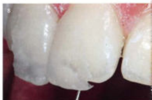
7 & 8 Für die Versorgung mit hauchdünnen Veneers aus VM 13 musste keine Zahnschubstanz geopfert werden